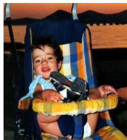
Giorgia n.2001 m.2004